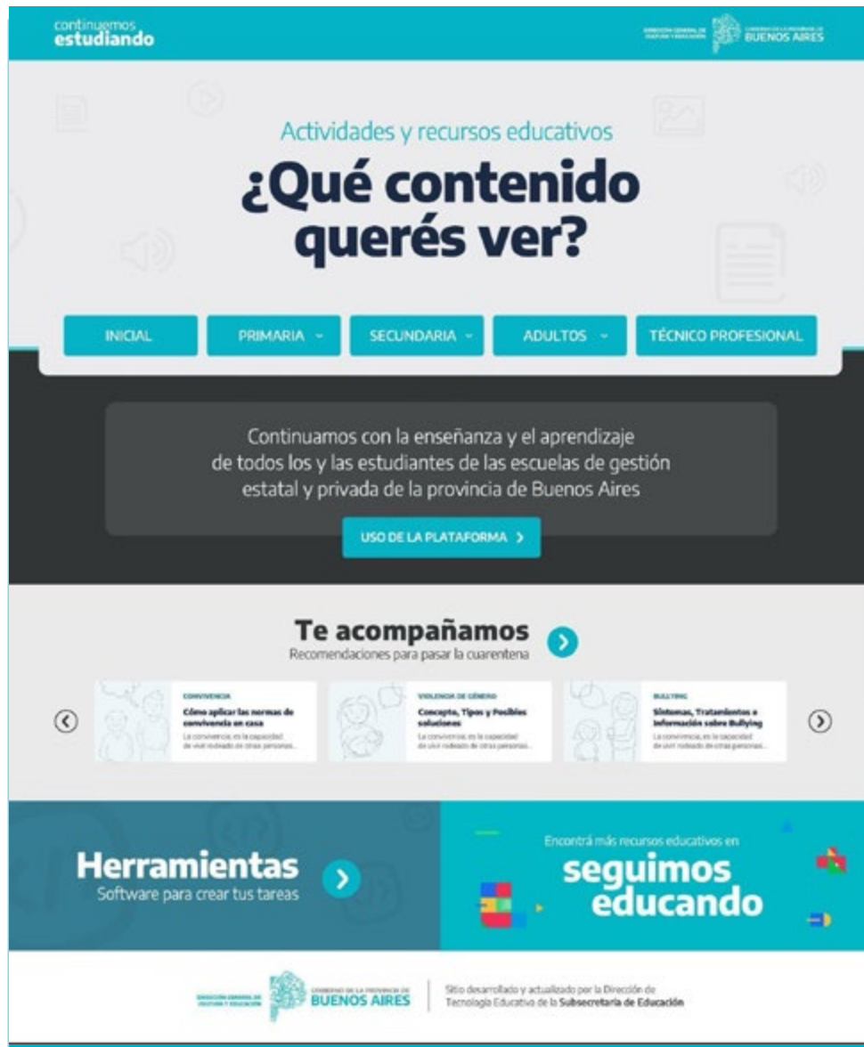
Imagen 1. Captura de pantalla de la página de inicio de la primera versión de Continuemos Estudiando. Abril de 2020

Una de las características más destacadas del portal fue su disponibilidad: tanto Continuemos Estudiando como otros sitios educativos de alcance nacional estuvieron exentos del consumo de datos móviles durante el ASPO. Esto fue posible gracias al acuerdo establecido por la Secretaría de Innovación Pública y el Ente Nacional de Comunicaciones (ENACOM) con los operadores nacionales de telefonía móvil (Claro, Movistar y Personal), que permitió que la navegación y la descarga de los recursos del sitio no consumieran datos. La decisión resultó clave para llegar a estudiantes y docentes sin conectividad plena constituyéndose, desde el inicio, como una herramienta concreta para enfrentar las desigualdades digitales y garantizar el derecho a la educación en condiciones extraordinarias.