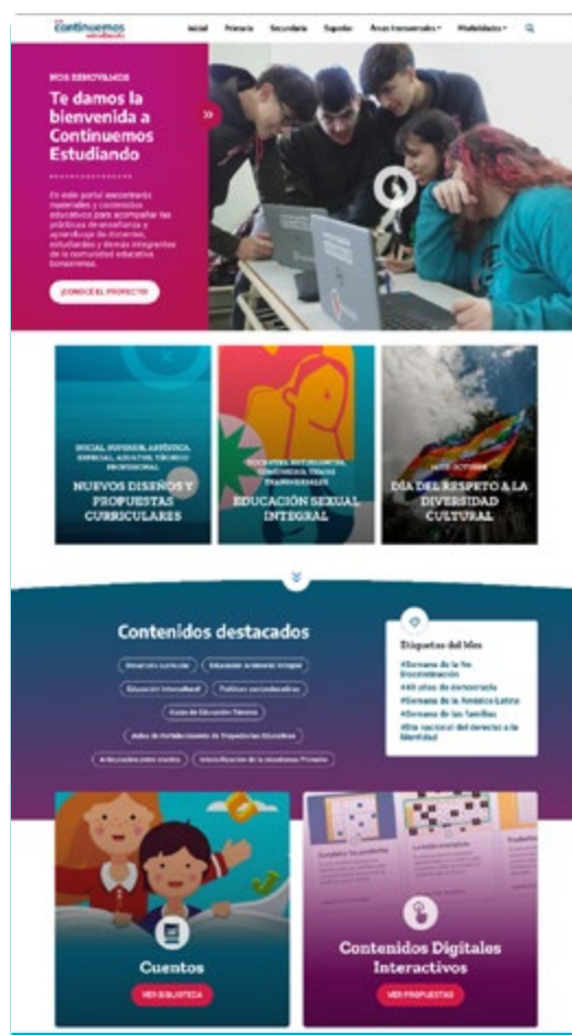
Imagen 4. Captura de pantalla de la página de inicio de la tercera versión de Continuemos Estudiando. Octubre de 2023

La página principal del portal ( home ) destaca, con periodicidad, un contenido central relacionado con efemérides, proyectos o iniciativas específicas. Además, presenta agrupaciones temáticas de materiales, etiquetas destacadas del mes, una nube de palabras y una sección de últimos recursos ordenados por fecha de publicación.