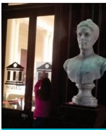
Imagen 4. Tareas de señalización realizadas por estudiantes de la Práctica profesional de la Tecnicatura Superior en Museología. ISFT n° 8. Año 2017

Los museos escolares fueron espacios clave en la formación pedagógica y en la construcción de una identidad nacional, integrando colecciones didácticas, científicas e históricas al sistema educativo. Su desarrollo en Argentina reflejó la tensión entre la adopción de modelos europeos y la adaptación al contexto local. Sin embargo, estos museos estuvieron fuertemente sujetos a políticas estatales inestables, lo que afectó su continuidad, financiamiento y proyección a largo plazo. A pesar de ello, dejaron un legado valioso en la forma de enseñar, promoviendo el aprendizaje a través de la observación, el contacto directo con los objetos y la experiencia concreta.