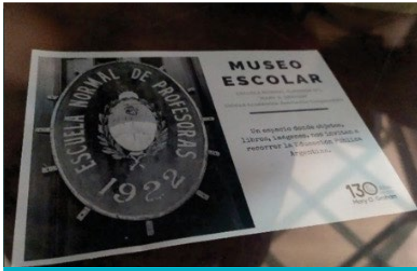
Imagen 2. Folleto entregado durante la inauguración de la exposición por el 130 aniversario de la Escuela Normal nº 1 Mary O. Graham. Colección Museo escolar. Unidad académica