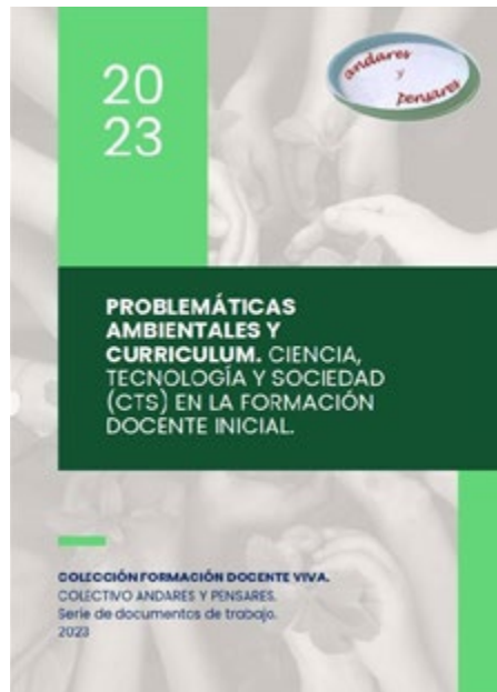
Documento de trabajo sobre Educación Ambiental.

Asimismo desarrollamos encuentros para abordar contenidos científicos controvertidos en el que se expresan diversos intereses de los miembros de una sociedad. La educación ambiental, la educación para la salud, la ESI y los DDHH. También llevamos a cabo un ciclo denominado “Conversaciones imprescindibles” en las que, a través de Meet, invitamos a debatir entre otros sobre Paulo Freire y la educación problematizadora o sobre los aportes de Manuel Belgrano a la educación. 8