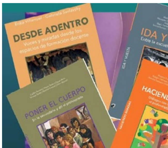
Ejemplares de la colección “La formación docente viva”.

Esta vivencia de escribir desde y para la formación docente de forma conjunta tratando temas y problemáticas que nos interpelan de diversas maneras, en distintos contextos sociales y niveles la plasmamos en la colección de libros llamada “La formación docente viva”, que tiene como destinatarias y destinatarios a las formadoras y los formadores, las futuras y los futuros docentes. Llevamos publicados cuatro títulos, 3 y estamos en el proceso de elaboración del quinto, centrado en la enseñanza de los derechos humanos en los distintos niveles. Por otra parte, contamos con un blog donde compartimos producciones de distintos docentes que se interesan por difundir su trabajo. 4 Además elaboramos un boletín en el que abordamos problemáticas actuales que interpelan a la formación docente. 5