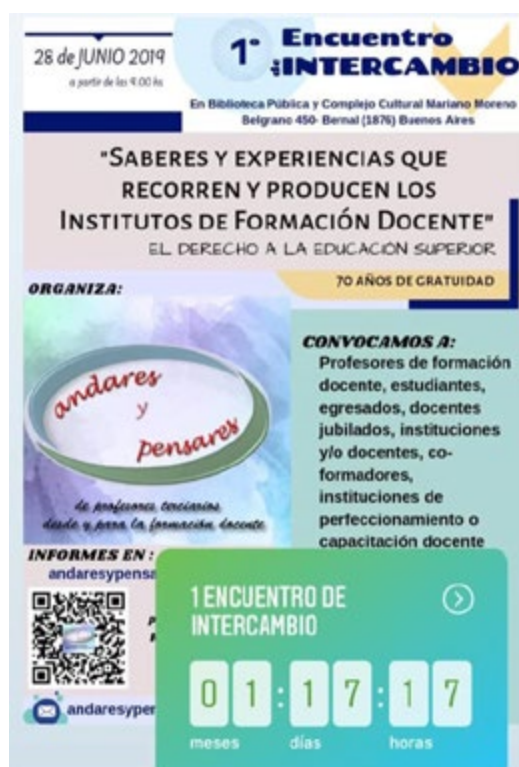
Convocatoria al Primer encuentro de intercambio de saberes organizado por Andares y Pensares.

Con este espíritu realizamos un encuentro de intercambio de experiencias y saberes en 2019, donde además conmemoramos los 70 años de la gratuidad de la educación superior. Participaron aproximadamente 80 docentes y estudiantes. Reunimos los trabajos presentados en una publicación digital, donde organizamos las ponencias por eje de trabajo. 2