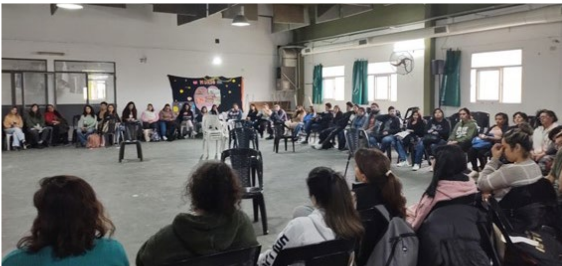
Taller Educación emocional o desarrollo de la afectividad, realizado en el ISFDYT n° 24.

Asimismo desarrollamos encuentros para abordar contenidos científicos controvertidos en el que se expresan diversos intereses de los miembros de una sociedad. La educación ambiental, la educación para la salud, la ESI y los DDHH. También llevamos a cabo un ciclo denominado “Conversaciones imprescindibles” en las que, a través de Meet, invitamos a debatir entre otros sobre Paulo Freire y la educación problematizadora o sobre los aportes de Manuel Belgrano a la educación. 8